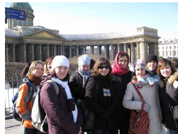
Kantiléna před Izakievským chrámem