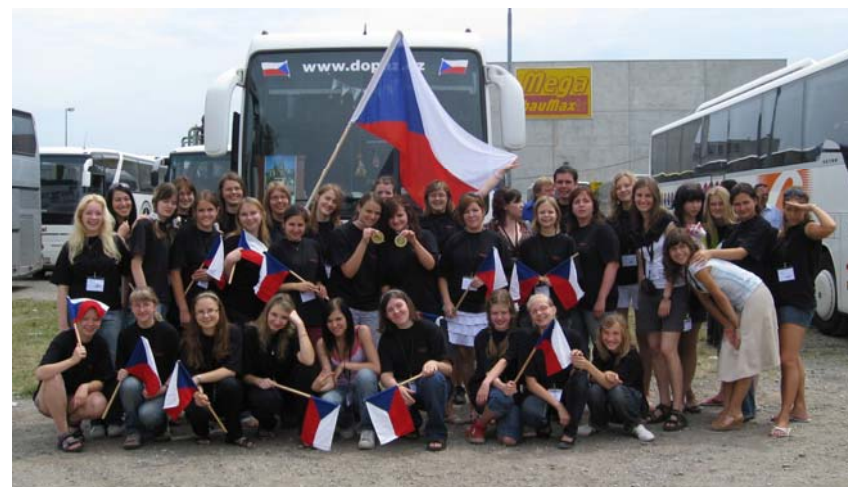
Kantiléna u Stadthalle v Grazu

Zvláště hrdý může být sbor na zlato získané v kategorii č. 16 – duchovní hudba, kde jsme byli věkově nejmladším sborem a samozřejmě bez mužské části ansamblu. I přes tuto zdánlivou nevýhodu jsme ale dokázali zvítězit. Se dvěma vzácnými