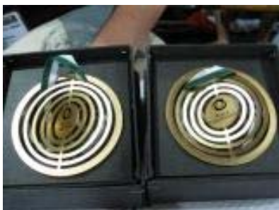
Dvě zlaté medaile ze Sborových her v Grazu

kovy na krku jsme se nakonec v těchto kategoriích umístili jako nejlepší z celé Evropy. CO víc dodat, snad jen: Viva la Kantiléna!