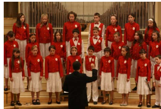
Kantilénka na jarním koncertě 2008